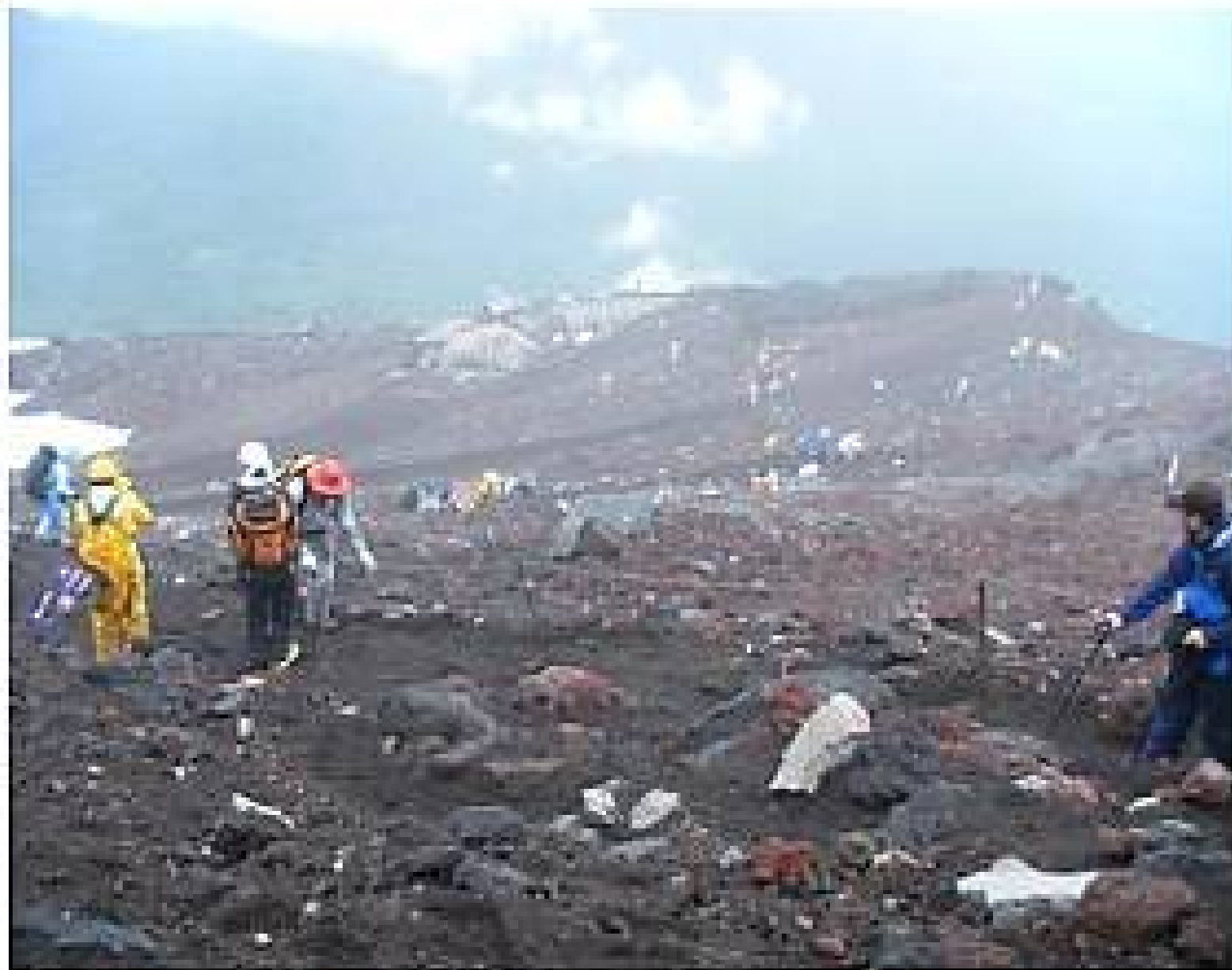
山頂から見た登山風景