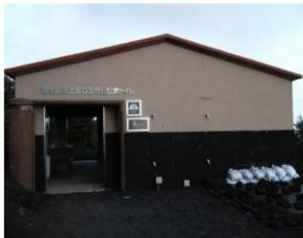
五合目公衆トイレ