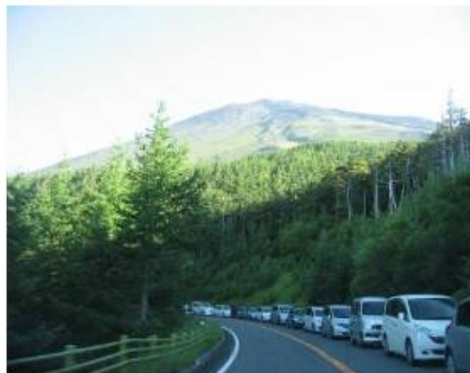
富士山スカイライン