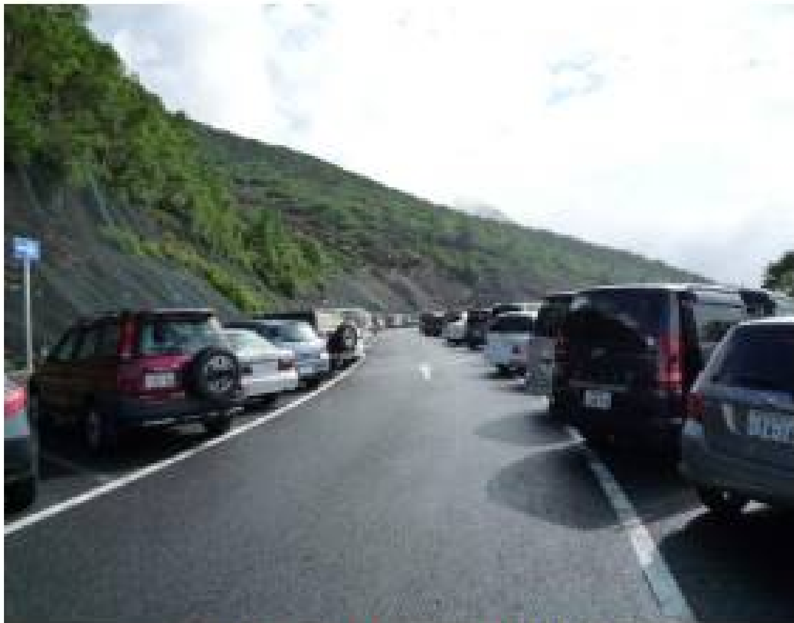
富士宮口五合目駐車場