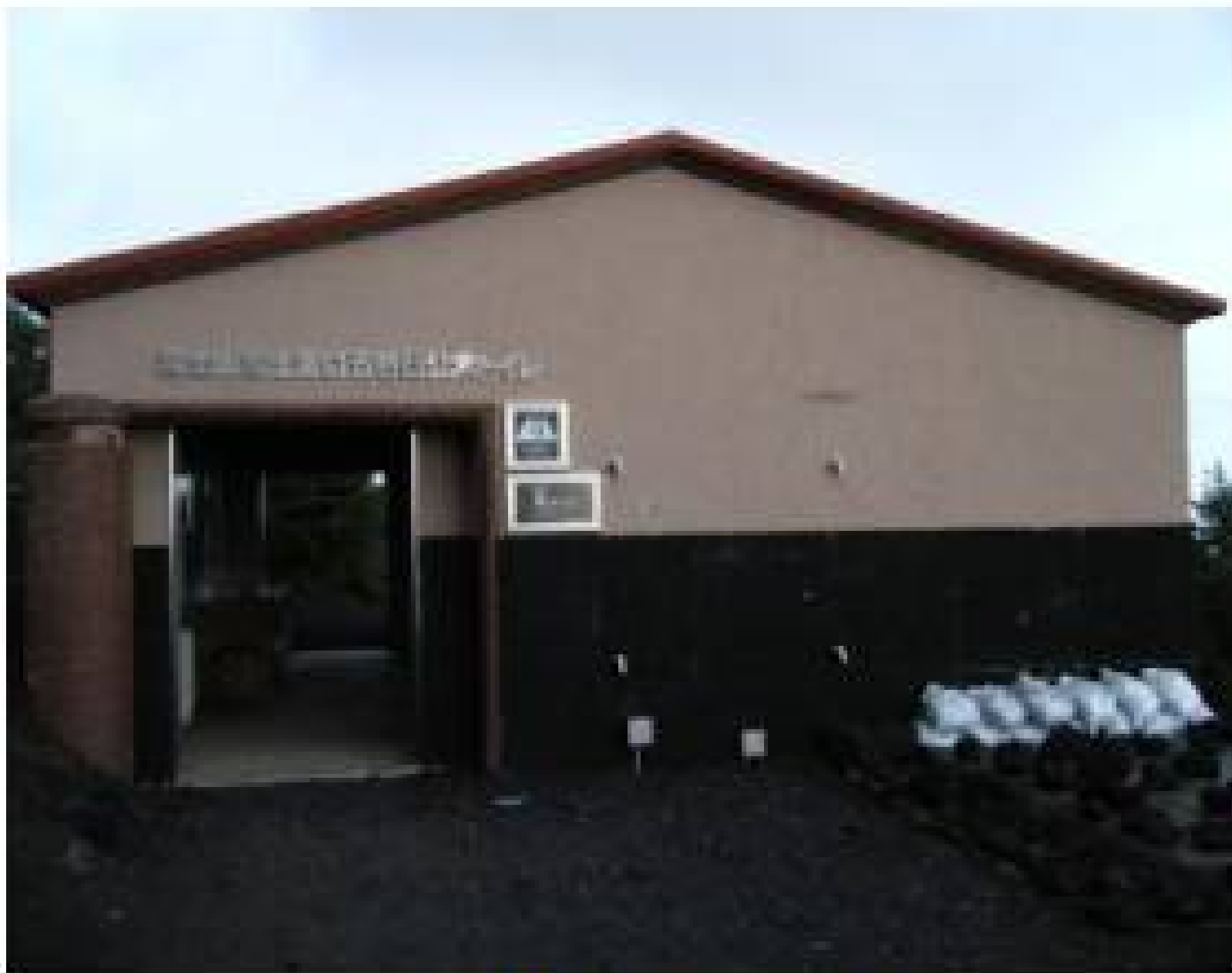
五合目公衆トイレ