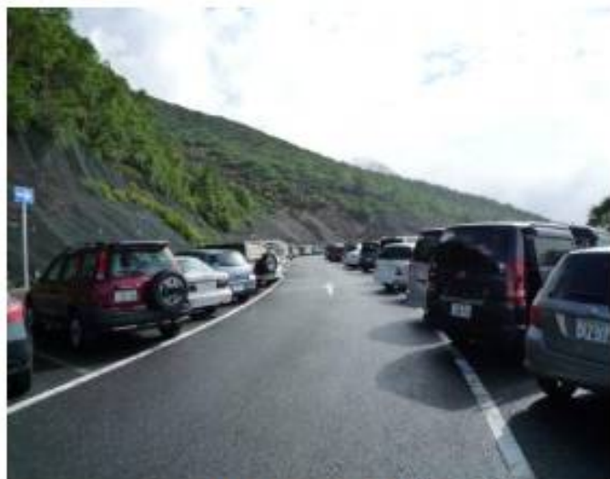
富士宮口五合目駐車場