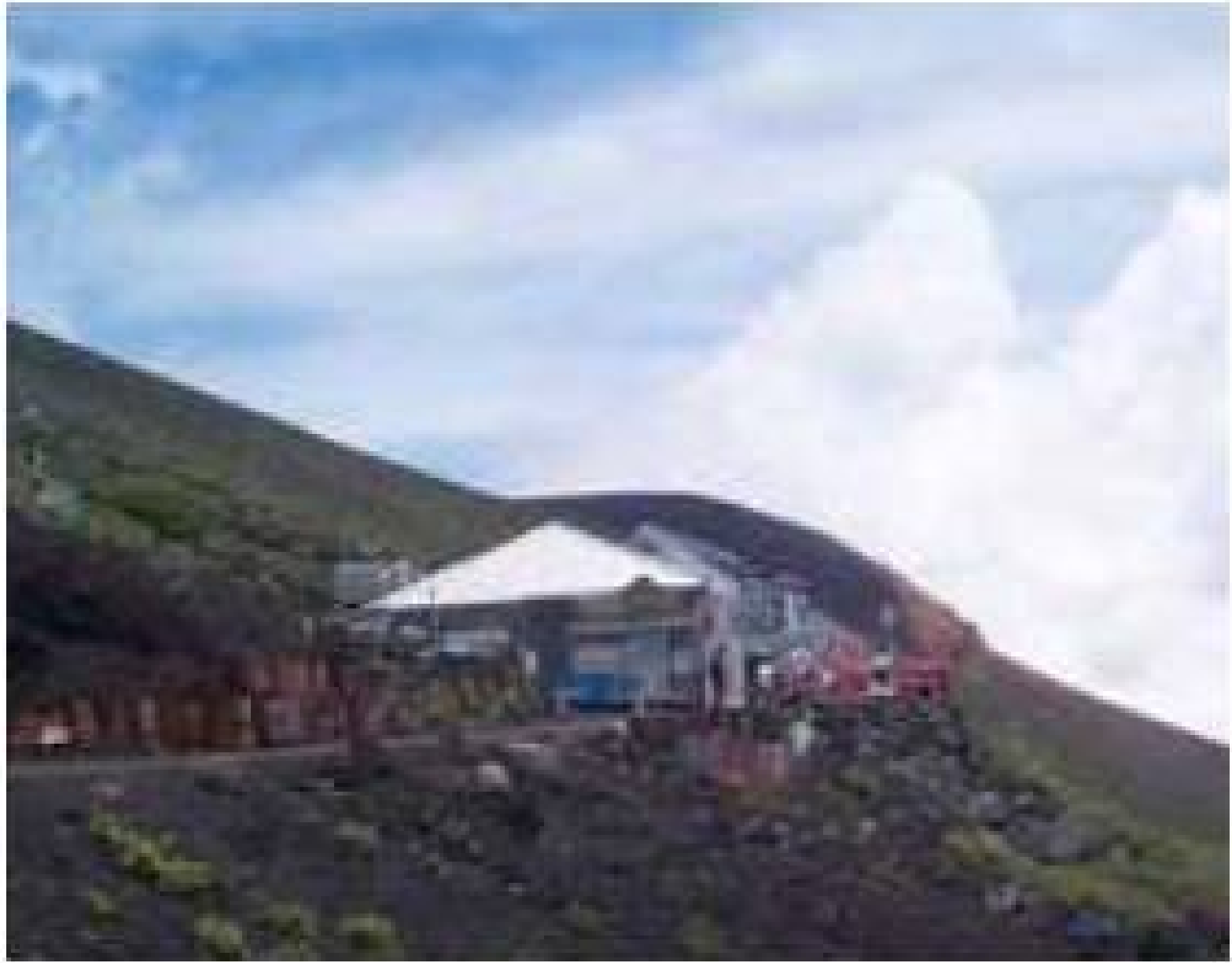
六合目山小屋周边