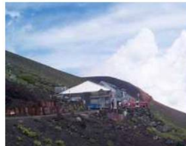
六合目山小屋周辺