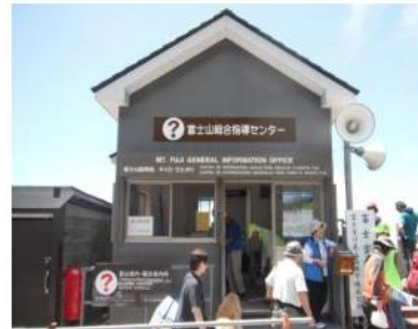
富士山総合指導センター