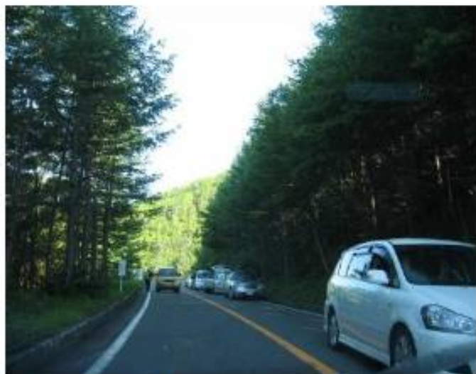
富士山スカイライン

350台分の駐車スペースはあるものの、夏山登山シーズンは、駐車場が満車となり、五合目下まで駐車渋滞が続くことがあります。 できるだけ公共交通機関をご利用ください。