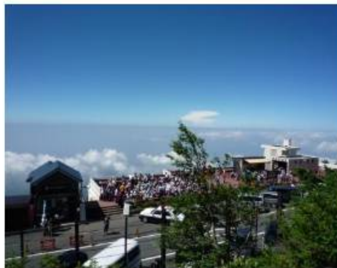
五合目レストハウス