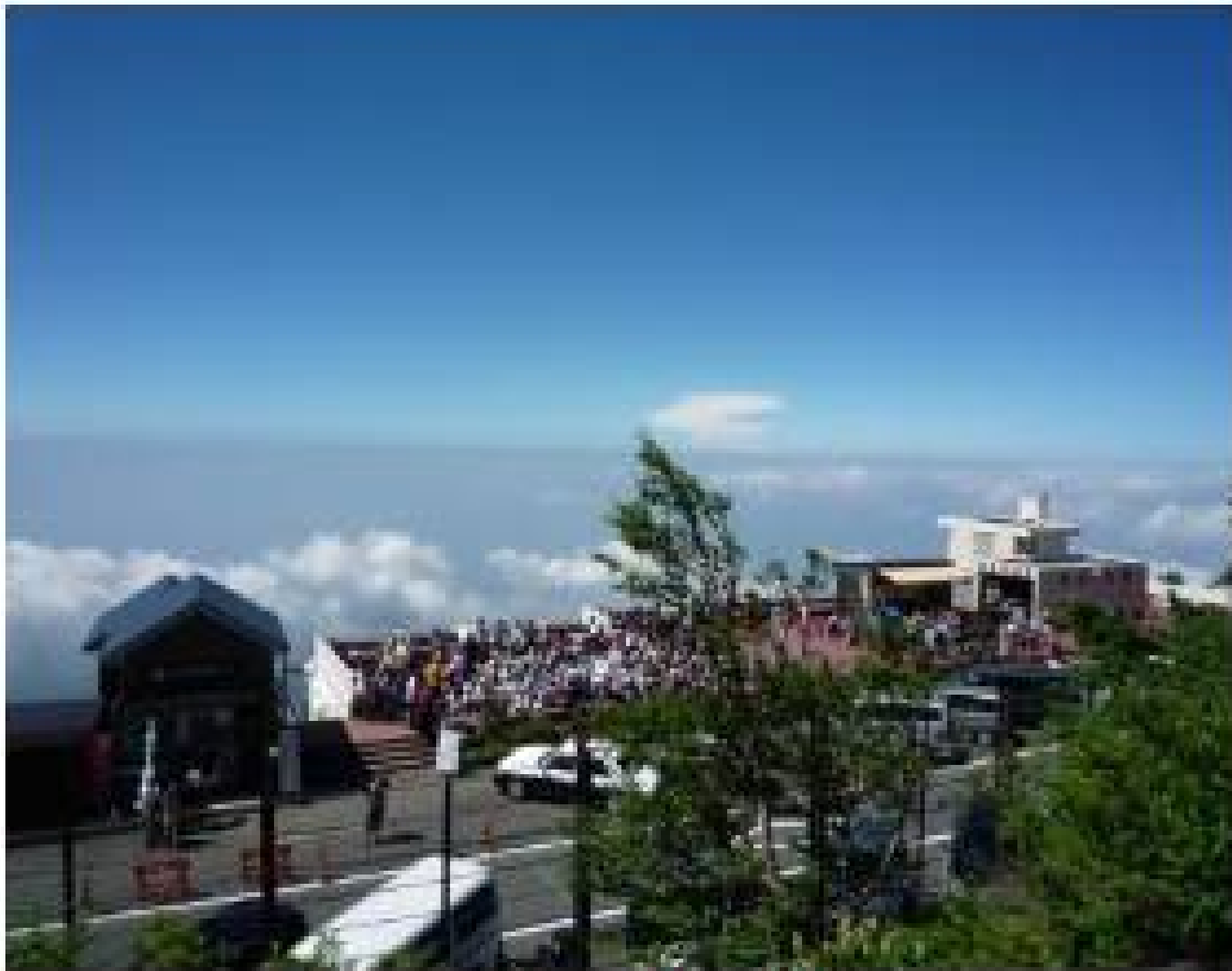
五合目レストハウス