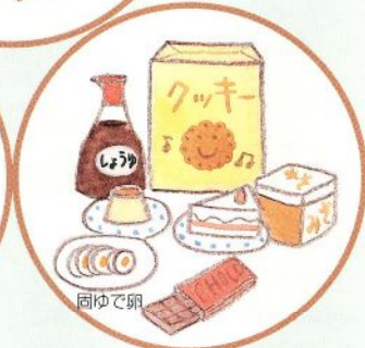
加熱した食品・加工食品