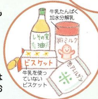
低アレルゲン食品