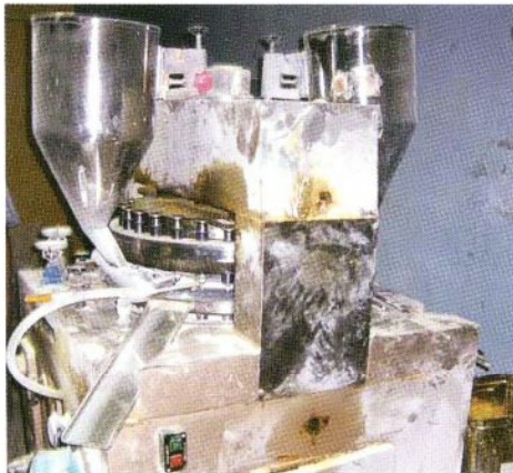
違法なにせもの製造設備

世界保健機関 (WHO) . www.who.int/mediacentre/factsheets/fs275/en/ [last accessed: September 2005]